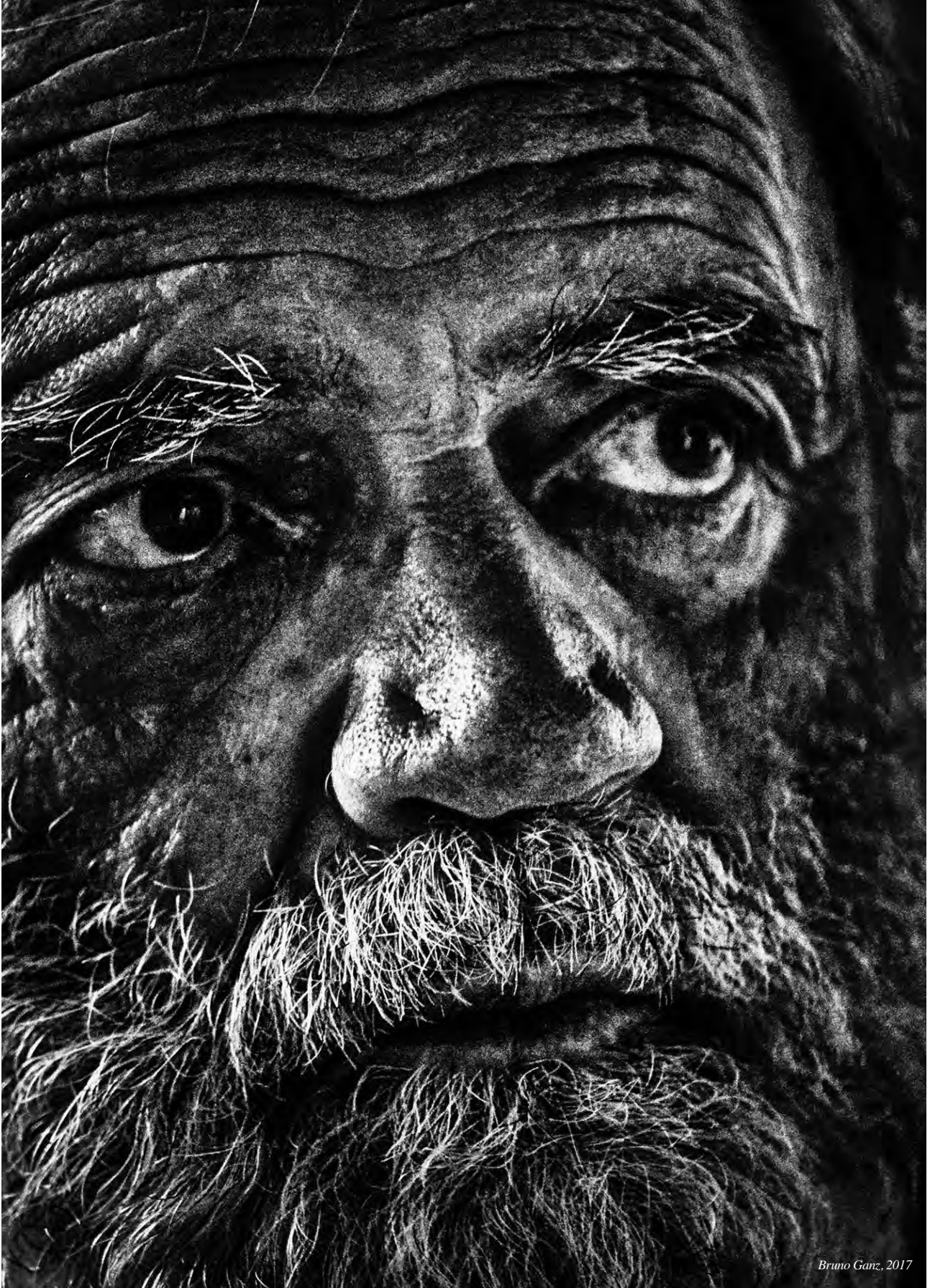
Bruno Ganz, 2017