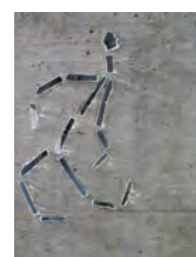
Danseur miroir, Pully 2005