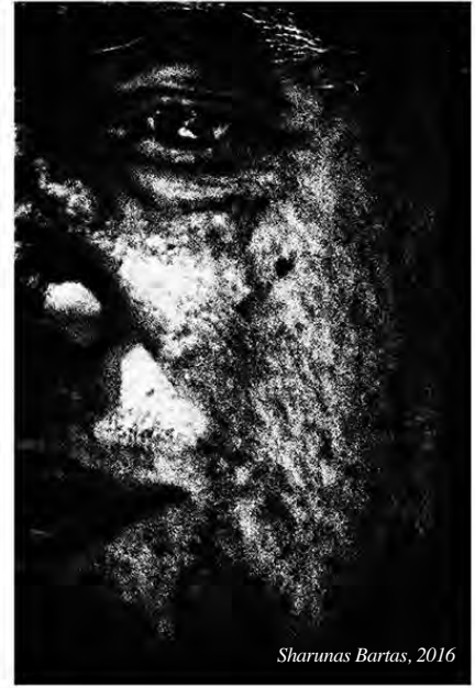
Sharunas Bartas, 2016