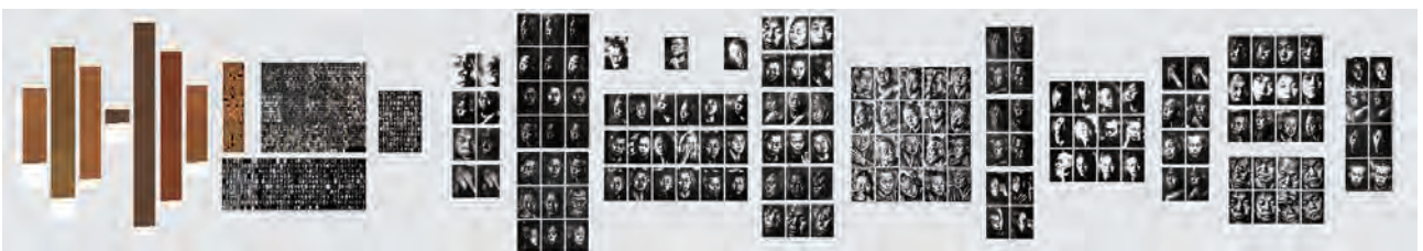
Kim Ki-duk (Série 2), 2020