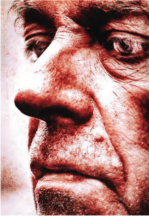
Enki Bilal, 2020